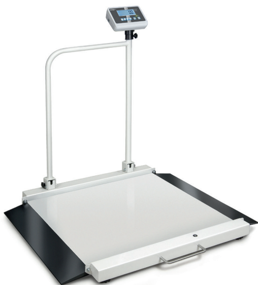
KERN MWA 300K-1PM

Rollstuhlwaage mit zwei integrierten Auffahrampen für bequemes Auffahren – mit Medizinzulassung für den professionellen, stationären Einsatz in der medizinischen Diagnostik, optional mit Eichung