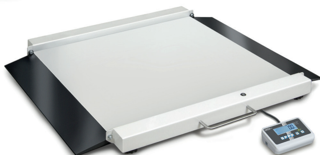
KERN MWA 300K-1M